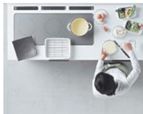
油を予熱しながら、天ぷらの衣を準備。