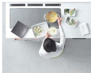
IHが奥にあるので油の飛散が少なく安心。