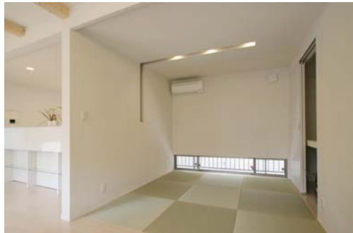
リビングに隣接する和室はロールカーテンで区切ることができ、くつろげる癒しの空間になっています。

夏は涼しく冬は暖かい空間を造る吹付け断熱の「フォームライトSL」を導入、建て主である若い30代夫婦の「若くても良い家を持ちたい!」という夢が実現したお家です。