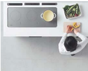
調理スペースで下ごしらえ。