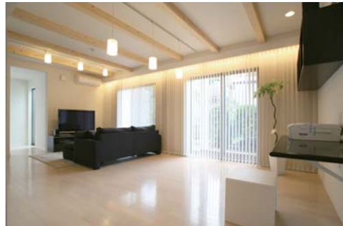
夏は涼しく冬は暖かい空間を作る吹付け断熱の「フォームライトSL」を導入、広々として光が十分に入るリビングダイニング。