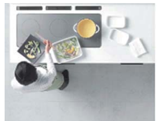
手前のスペースを活用。ラクに油切りや盛り付け。